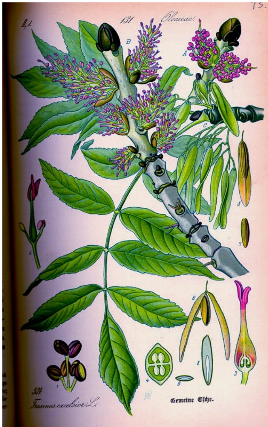
THOMÉ, OTTO WILHELM: Flora von Deutschland, Österreich und der Schweiz