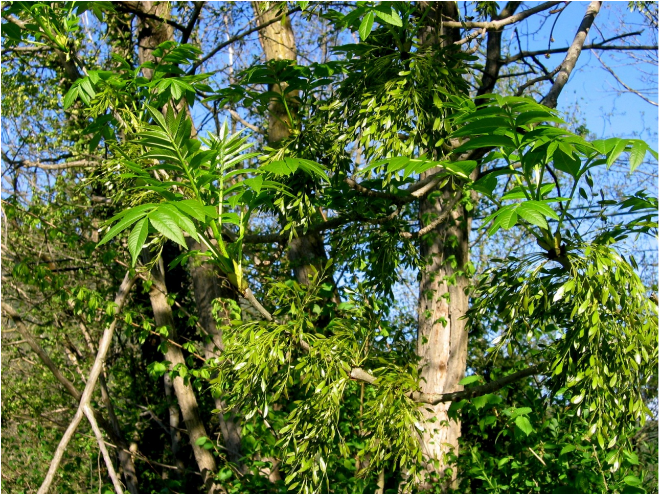
Fraxinus excelsior .